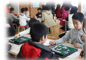
児童クラブ連合会 オセロ大会