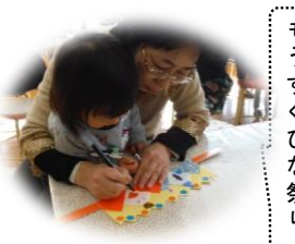
もうすぐひな祭り。