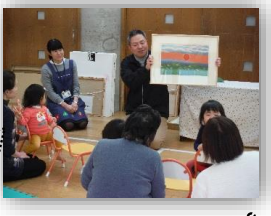
入善町所蔵画の説明