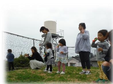
シャボン玉どこ行くのかな?