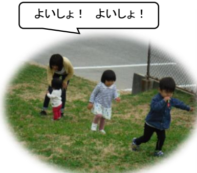
よいしょ! よいしょ!