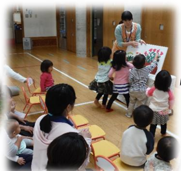
金魚がにげた!「ここだよ。」