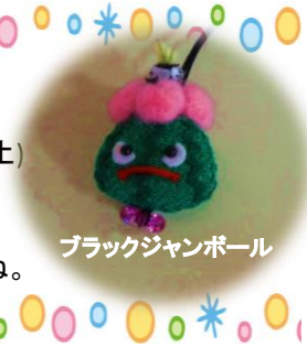
ブラックジャンポール