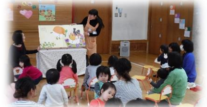
絵本の読み聞かせ（入善図書館より）